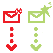
Illustration du service e-securemail continuity